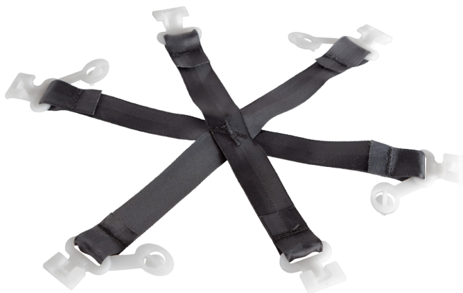
IH 000 100 020 paski nośne