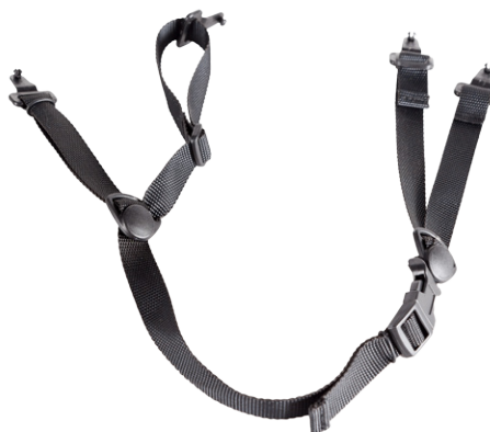
IH 000 001 000 regulowany, 4-punktowy pasek podbródkowy