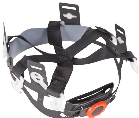
IH 000 200 000 więźba stała