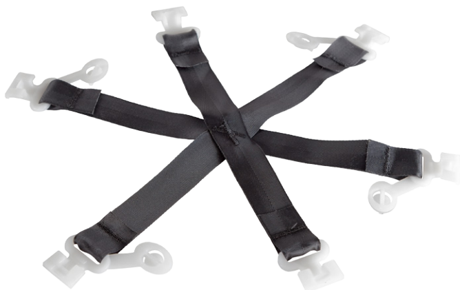
IH 000 100 020 paski nośne