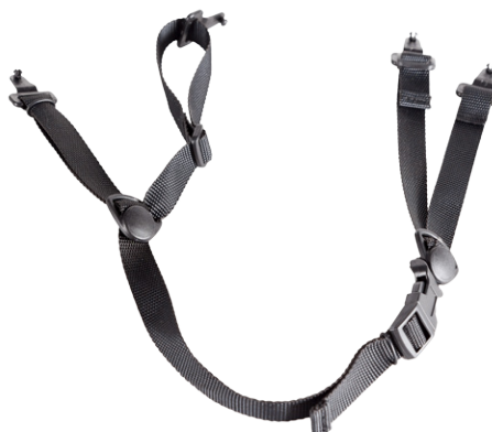
IH 000 001 000 regulowany, 4-punktowy pasek podbródkowy