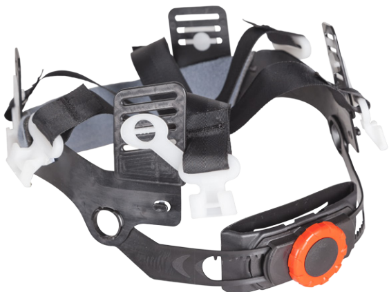
IH 000 100 000 więźba obrotowa