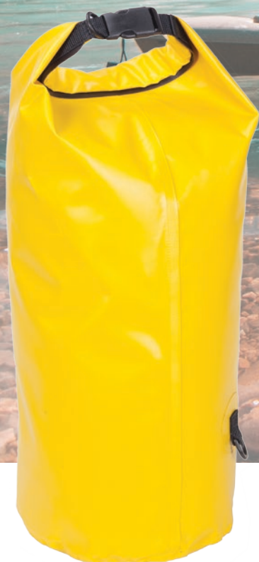
WX 003 XX 35 litrów